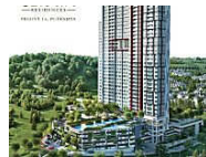
S P Setia stamps its mark of excellence in Seraya Putrajaya The Edge Property ( http://www.theedgeprop.com/seraya-putrajaya?utm_source=Outbrain&utm_medium=liens&utm_campaign=940&utm_term=mark-excellence-seraya-putrajaya )