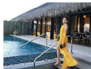
The Millionaire Secret! Hurry Before This Video Gets Banned in Malaysia! direct news 24 ( http://www.directnews24.com/my/millionaire-secret/ )