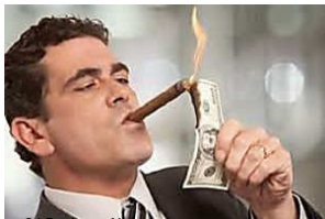
24 Business News http://www.24businessreport.com/ Malaysian banks are trying to

SALAH (/SALAH) BERITA (/BERITA) SUKSES (/SUKSES) MAGAZIN (/MAGAZIN) KALAM KUNCI (/KALAM KUNCI) KALAM KUNCI (/KALAM KUNCI) KALAM KUNCI (/KALAM KUNCI)