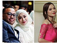
Adnan dakwa Adira hamil pula ( http://www.bharian.com.my/node/214750 )