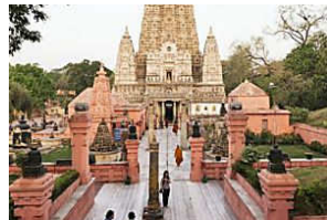
http://www.mariefranceasia.com/ 10 Reasons why India is one of