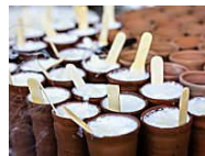
Top 10 things you must definitely eat when you're in India Marie France ( http://www.mariefrance.com/asia/my/traditional-dishes-india-214113.html?utm_source=Outbrain&utm_medium=liens&utm_campaign=940&utm_term=accomplished )