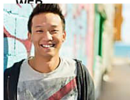
25 year old Malaysian is one of Dubai's richest men, and his way to riches is to 24 Business News ( http://www.24business.com.my/step-to-riches/ )